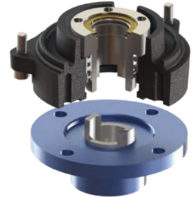
Forme · Form C

Alésage claveté (Ø20 mm max.). Fixation par quatre trous taraudés M10 (profondeur 20 mm) ou quatre trous taraudés M8 (profondeur 15 mm) Small keyed bore (Ø20 mm max.) Connection with four M10 threaded holes (depth 20 mm) or four M8 threaded holes (depth 15 mm)