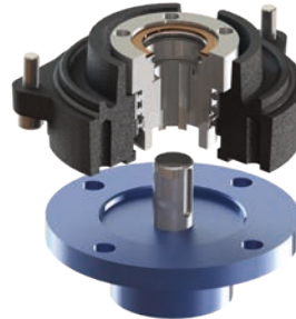
Forme · Form B3

Boîte à écrou pour grand alésage (Ø42 mm & hauteur 48mm max.). Fixation par quatre trous taraudés M10 (profondeur 20 mm) ou quatre trous taraudés M8 (profondeur 15 mm) Drive bush for large keyed bore (Ø42 mm & height 48 mm max.) Connection with four M10 threaded holes (depth 20 mm) or four M8 threaded holes (depth 15 mm)