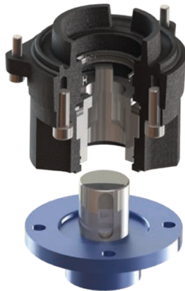
Forme · Form B1

Boîte à écrou pour tige de vanne fileté (Ø25 mm max.). Fixation par quatre trous taraudés M10 (profondeur 20 mm) ou quatre trous taraudés M8 (profondeur 15 mm) Drive bush for threaded valve stem (Ø25 mm max.) Connection with four M10 threaded holes (depth 20 mm) or four M8 threaded holes (depth 15 mm)